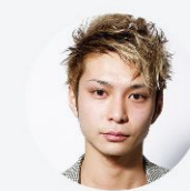
得意なレングス&技術 ショート・メンズ・パーマ