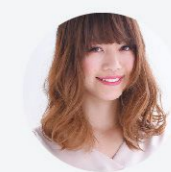
得意なレングス&技術 ミディアム・パーマ