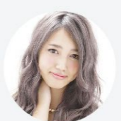
得意なレングス&技術 ロング・カラー