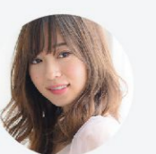
得意なレングス&技術 ミディアム・パーマ