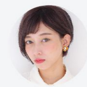
得意なレングス&技術 ショート・縮毛矯正