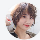
得意なレングス&技術 ショート・パーマ