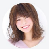
得意なレングス&技術 ポブ・縮毛矯正