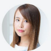
得意なレングス&技術 ロング・縮毛矯正