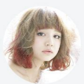
得意なレングス&技術 ポブ・カラー